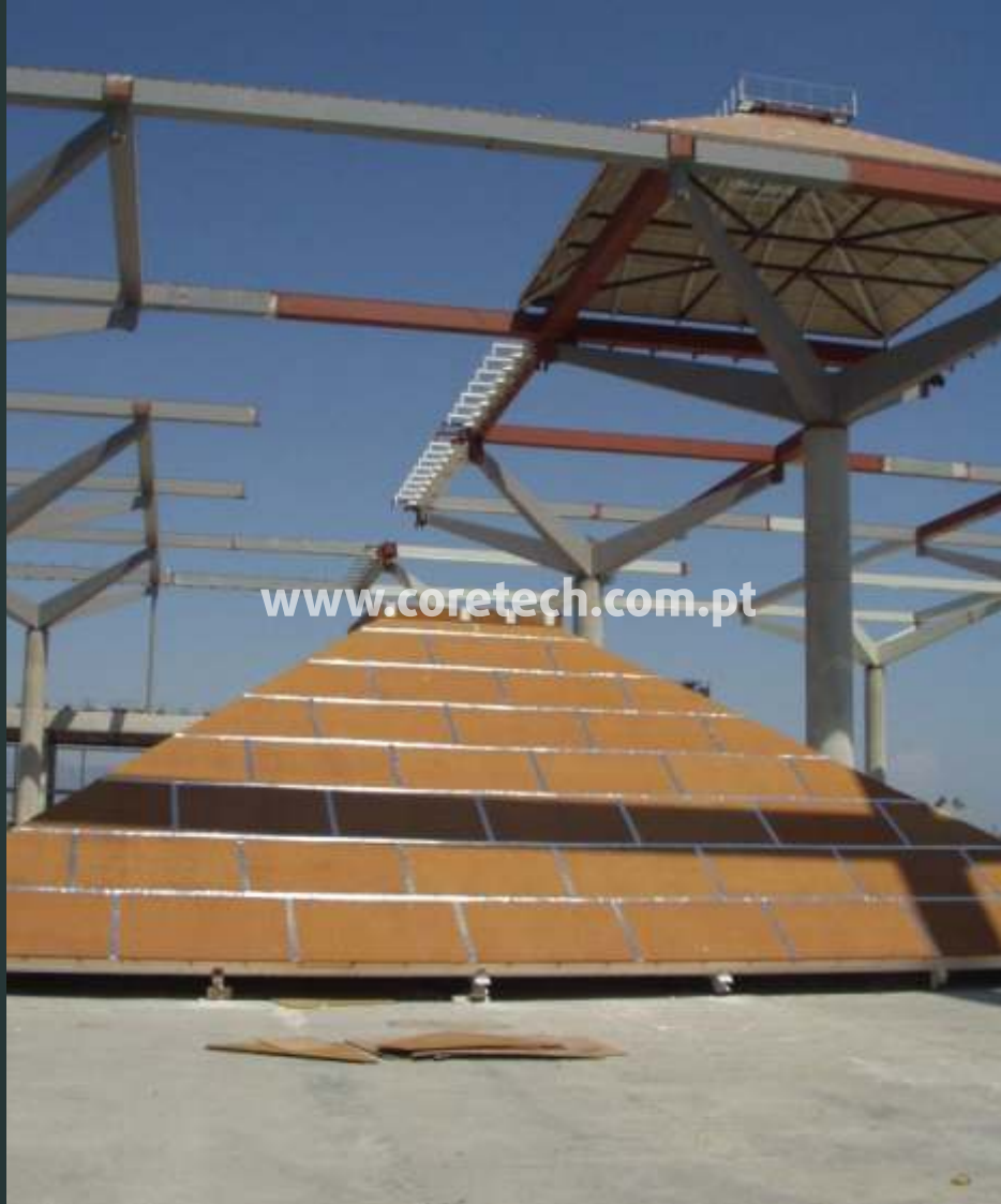
Cobertura do aeroporto de Málaga